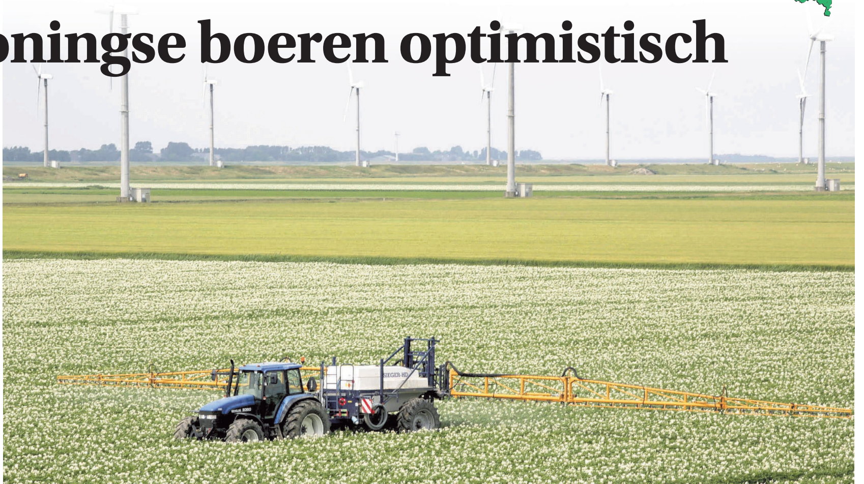
Groningse ondernemers noemen vooral de ruimte, het klimaat, de goede verkaveling, de goede kwaliteit van grond en de omvang van het bedrijf als sterke punten.